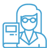
Matières de l'option Santé et des licences

Afin de maximiser vos chances d'intégrer les études de santé, nous vous accompagnons sur les matières de l'option Santé, les enseignements transversaux et ceux de la licence choisie. Nous vous proposons également une Pré-rentrée qui vous permettra de démarrer sereinement et efficacement votre année.